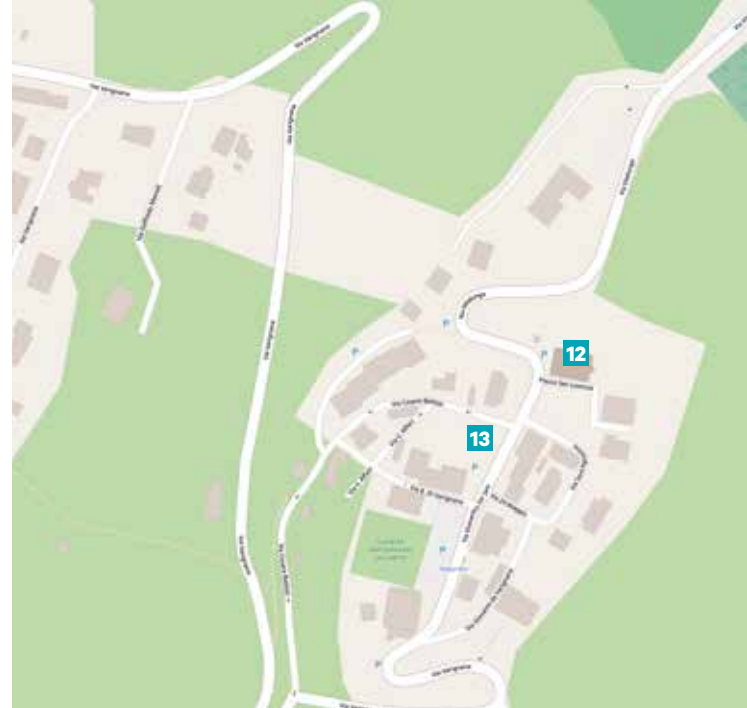
Frazione di Castel San Pietro Terme Hamlet of Castel San Pietro Terme