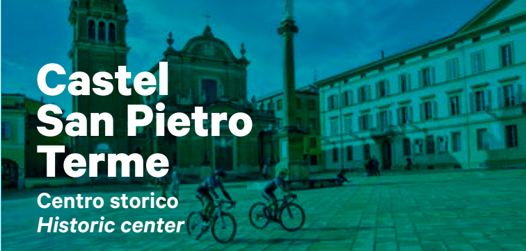
Castel San Pietro Terme Centro storico Historic center