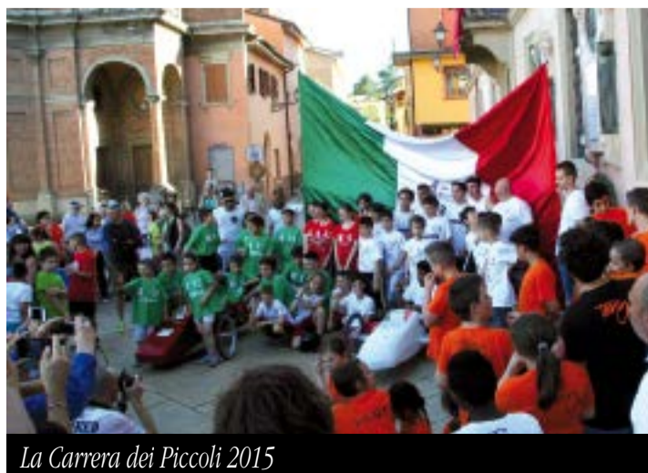
La Carrera dei Piccoli 2015

E a questo punto, via libera all'estate, con la rassegna di musica e teatro al Giardino degli Angeli , i prestigiosi concerti di Emilia-Romagna Festival, gli appuntamenti con il ballo e le prove libere della Carrera , regina del Settembre Castellano insieme a Varignana di Notte , Sagra della Braciola , Crapule e Fiera del Miele . In autunno si inaugureranno, come di consueto, le stagioni teatrali al Cassero e al Jolly e torneranno: Borghi Aperti , evento di promozione turistica patrocinato dalla Regione; la 13 a Festa Internazionale della Storia ; la 30 a edizione del Convegno Nazionale Incontri con la Matematica e la tre giorni medioevale L'Antico Castello , fino ad arrivare, senza soluzione di continuità, al programma natalizio di Castelanadel . Durante tutto l'anno, tante mostre (una quindicina quelle già in calendario), serate di musica, incontri, gli appuntamenti con Castro Antiquarium , il mercato dell'antiquariato e del riuso che si tiene l'ultima domenica del mese, e con tutti gli altri mercati, ordinari e straordinari.