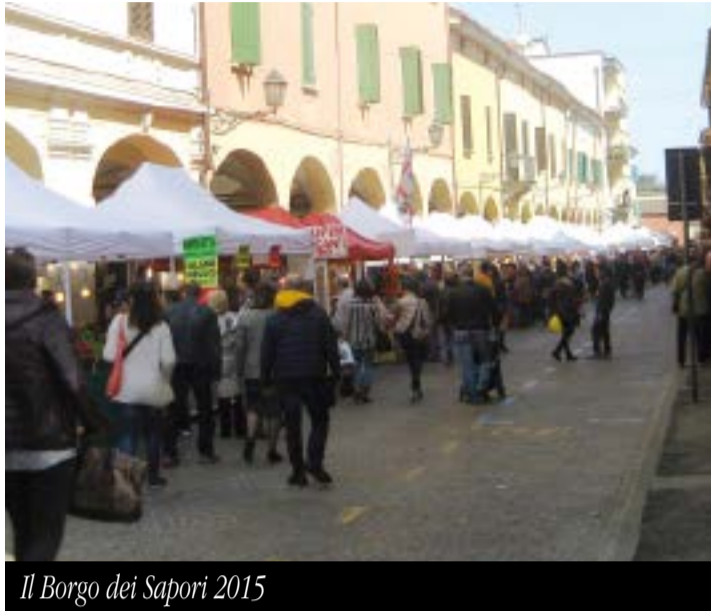
Il Borgo dei Sapori 2015