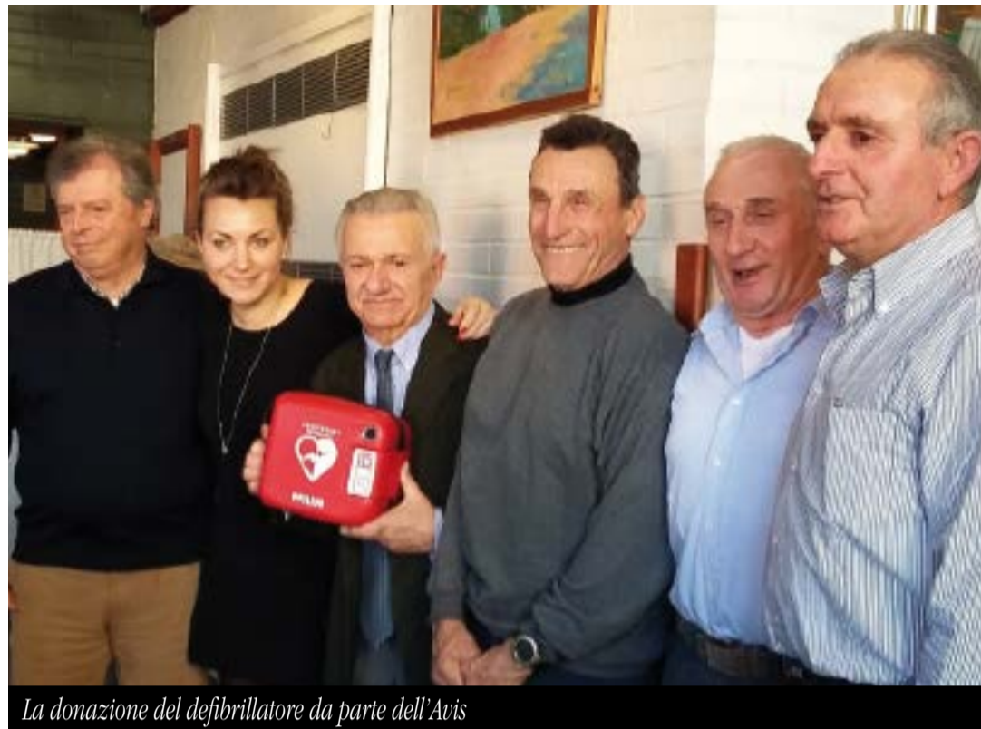
La donazione del defibrillatore da parte dell'Avis

Il decreto Balduzzi prevede che ogni impianto sportivo attivo sul territorio sia dotato di defibrillatore e che ogni associazione sportiva che utilizza queste strutture abbia personale formato per utilizzare nel bisogno queste apparecchiature nella maniera migliore. L'Assessorato allo sport si è