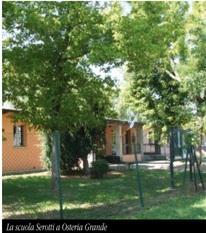
La scuola Serotti a Osteria Grande

Il Comune ha ricevuto, da parte di tutte le realtà coinvolte, la delega allo sviluppo delle relazioni tecniche con l'Agenzia del Demanio, con il Miur, con l'Ance-Fondazione Patrimonio Comune e con eventuali soggetti privati interessati ad avanzare proposte di valorizzazione. Lo strumento utilizzato per realizzare l'operazione è un fondo immobiliare costituito da beni inutilizzati dei Comuni, dalla cui valorizzazione deriveranno le risorse per costruire o rigenerare i nuovi edifici scolastici. Partirà quindi ora la fase di analisi degli immobili proposti dai Comuni, che permetterà di avere entro l'estate lo studio di