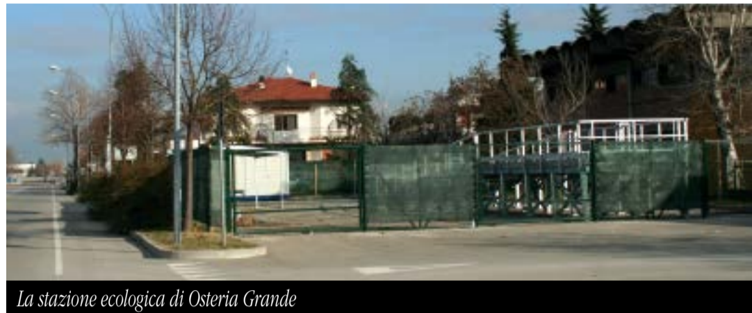
La stazione ecologica di Osteria Grande

S ono stati completamente distribuiti i contributi erogati dal Comune a rimborso della Tari (tassa rifiuti) pagata nell'anno 2014, a 193 cittadini e famiglie in difficoltà (con Isee inferiore a 18.500 euro). I contributi sono stati assegnati con un bando, chiuso a fine 2015, che metteva a disposizione un fondo di 40mila euro. La notizia è stata annunciata nelle passate settimane al